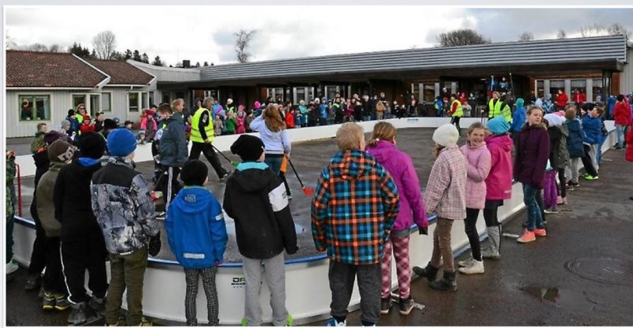
Valboskolan i Färjelanda

Bidrag av Folkhälsorådet i Färgelanda Kommun